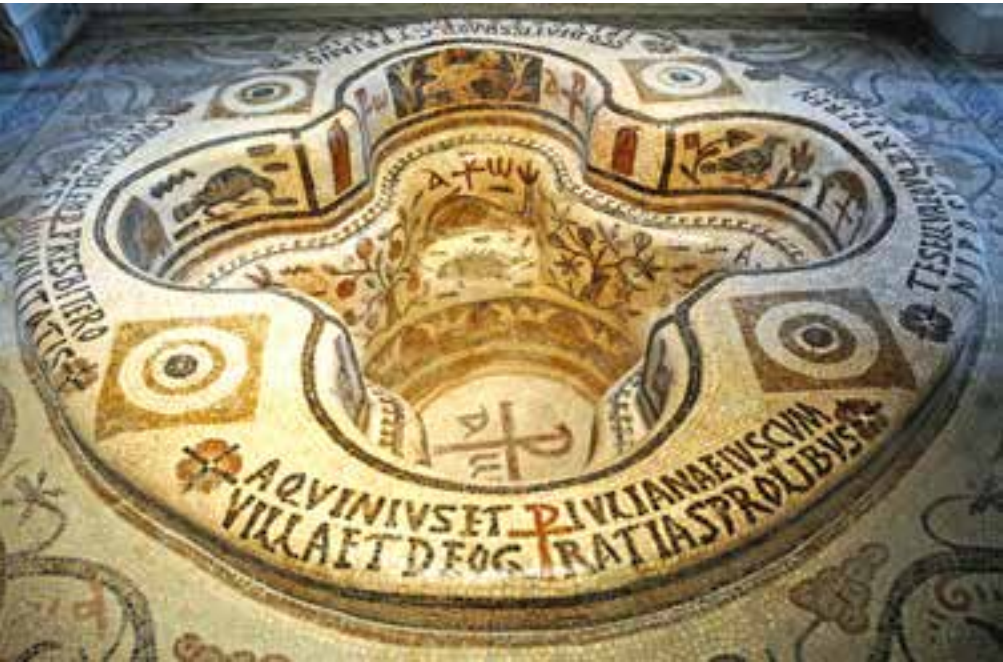
Baptistère de Kélibia (Tunisie) VI ème s.

JOURNAL DES 4 PAROISSES PROTESTANTES DE LA RÉGION SALÈVE