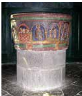
Cuve baptismale Basilique N.-D. des Miracles. (Cantal XII ème s.)