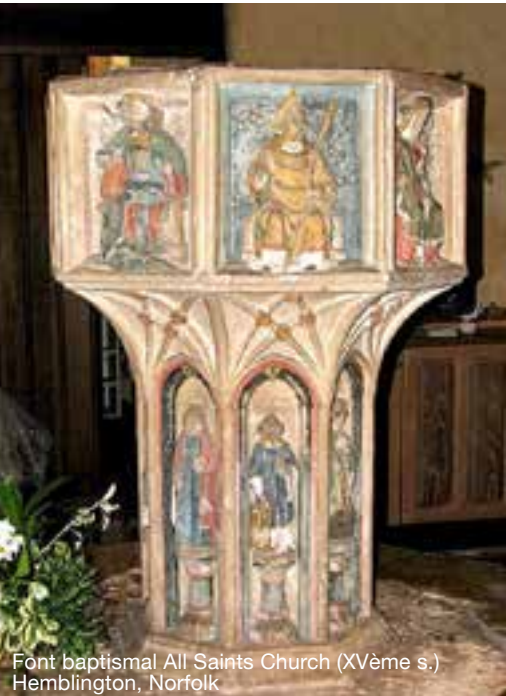
Font baptismal All Saints Church (XVème s.) Hemblington, Norfolk

Le Porche du Mystère de la deuxième vertu (1912) in Poésie / Gallimard