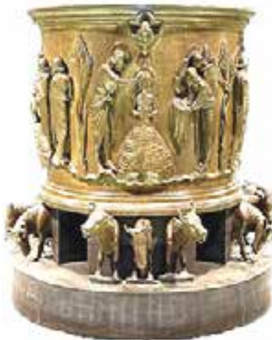
Fonts baptismaux du XII ème s. Liège