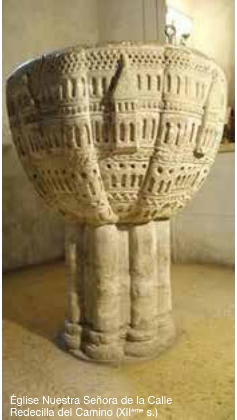
Église Nuestra Señora de la Calle Redecilla del Camino (XI ème s.)

Vous cheminerez ensuite plus personnellement avec le ou la ministre qui présidera le baptême ou la présentation de votre enfant pour parler plus spécifiquement de la célébration. ≡