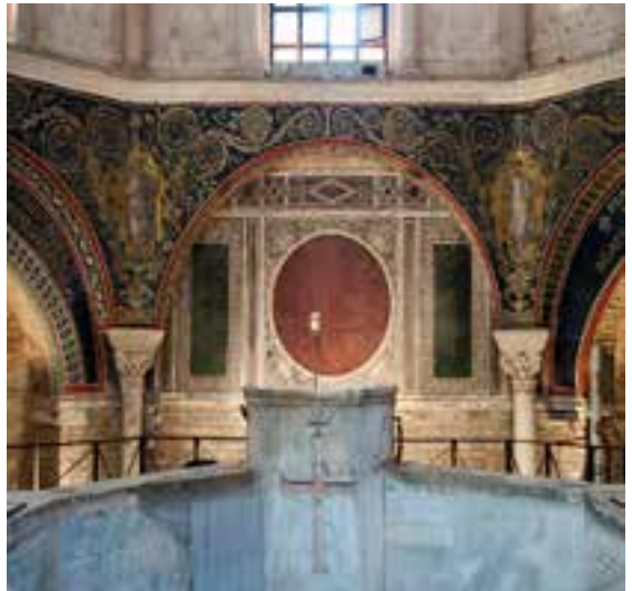
Baptistère de Néon (Ravenna V ème s.)