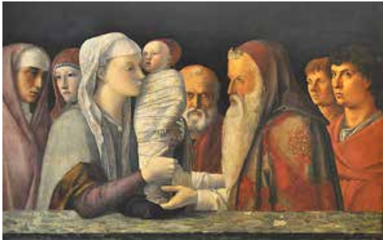
Bellini, La Présentation de Jésus au Temple (1460)

Nous avons, ma femme et moi, décidé de présenter nos deux filles à la communauté chrétienne plutôt que de les faire baptiser lors de leur tout jeune âge. Laissez-moi vous expliquer pourquoi nous avons fait ce choix pour débiter l'éducation religieuse de nos enfants :